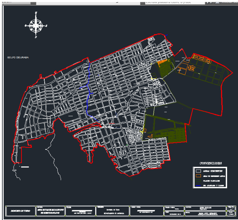
APS EN EL CONTEXTO ÁREA URBANA Y ZONAS DE EXPANSIÓN

ANEXAMOS MAPA SOBRE AREA DE PRESTACION DEL SERVICIO-APS MUNICIPIO DE TURBO.